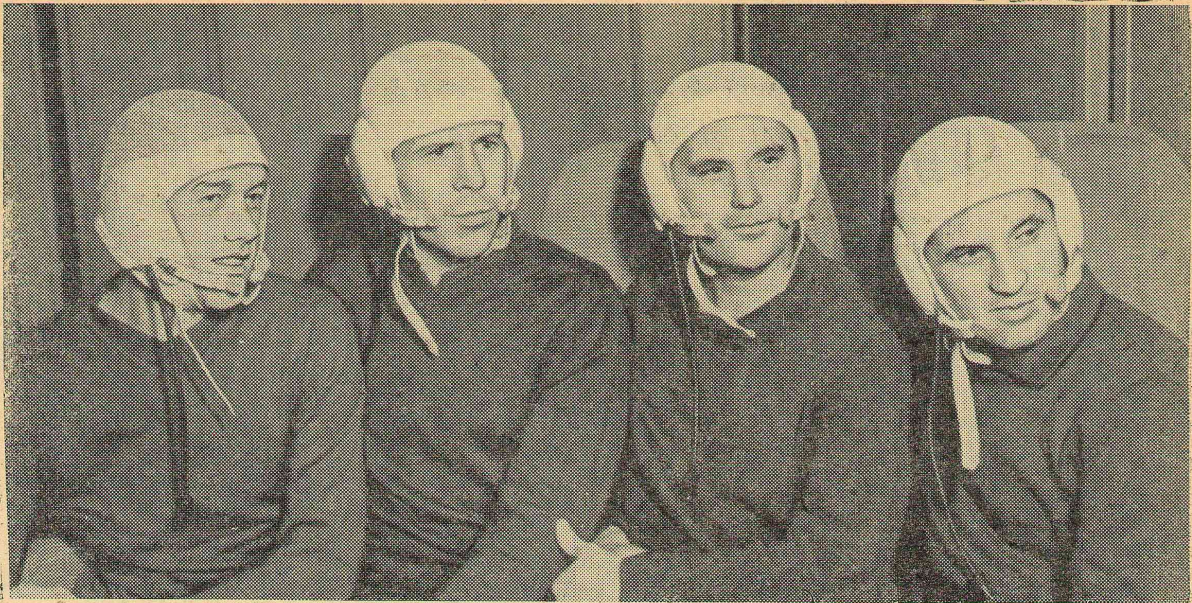
Летчики-космонавты (слева направо): член экипажа космического корабля «Союз-5» борт-инженер Алексей Станиславович ЕЛИСЕЙЕВ, член экипажа корабля «Союз-5» инженер-исследователь Евгений Васильевич ХРУНОВ, командир корабля «Союз-4» Владимир Александрович ШАТАЛОВ, командир корабля «Союз-5» Борис Валентинович ВОЛЬНОВ.

Чтобы отдых был веселым... Близятся зимние каникулы. Хотят отдохнуть наши студенты? 27 января в Красноярске нет работы дом отдыха «Восток». Чтобы мечта каждого студента хорошо отдохнуть стала реальностью, нужно очень много: четыре рубля на семей и максимум изобретательности. Да, еще заявление в профком института. Первый сезон начинается с 27 января, второй — с февраля. В этом году текстильное объединение «Восток» предоставит для института свой прокатный — большое уютное помещение. Семь дней в лесу, дине с соснами, свежим воздухом, лыжной — это очень дешево. А если будет сильный мороз — тоже не беда. Будет заниматься и в помещении. В услугах студентов — библиотека, телевизор, бильярд собственной выдумка. Кроме того, в зимние каникулы для студентов организуется экскурсия в Москву. Пройдет она будет с 31 по 6 января. Стоимость путевки рублей. В профкоме есть путевки и в дом отдыха — Чернолучинский и Иртышский. Областной совет по туризму низует студенческий поезд маршрут: Омск—Москва—Ленинград—Омск. Путь будет стоить всего 40 рублей. Если кому-то из студентов будет непонятно, в любое время обращайтесь за объяснениями в профком. ПРОФКОМ ИНСТИТУТА.