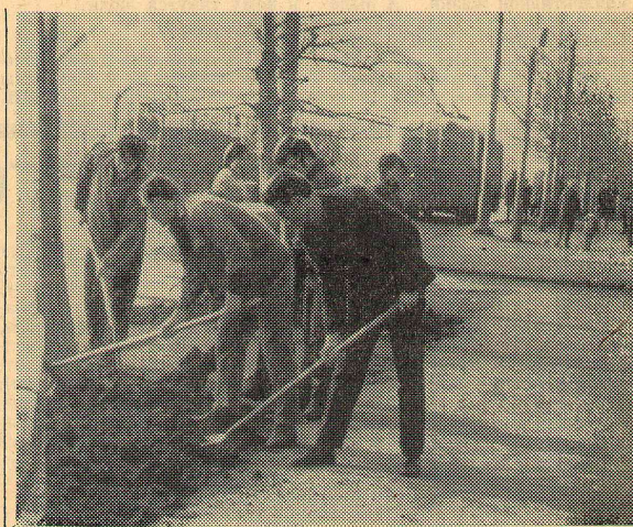
На снимке Н. Мищука: кинит работа по уборке территории прилегающей к общежитию № 2.

Неудовлетворительную оценку можно поставить умело, то