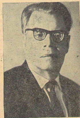
На снимке: М. В. Исаковский.

Поэзия М. В. Исаковского о суровой, завидной и ясной судьбе нашей Родины суждена долгая жизнь.