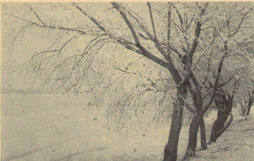
«Поет зима, аугает, Мохнатый лес баюкает...»