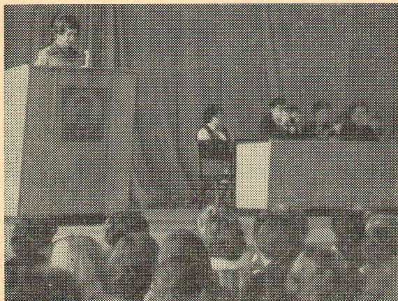
Итоговая конференция по летней педагогической практике.