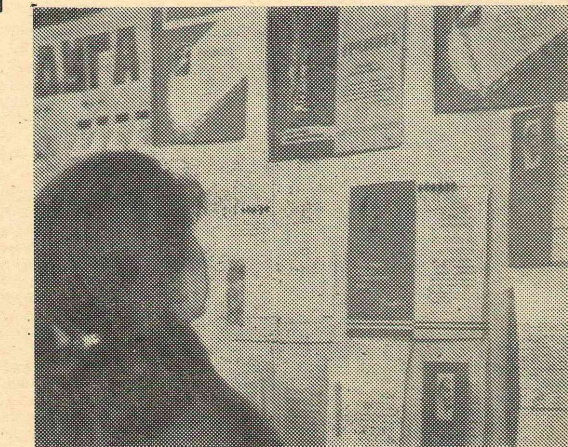
В выставочном зале.