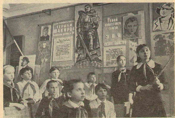
В школьном музее. Воспитание на примерах героического прошлого нашей Родины.