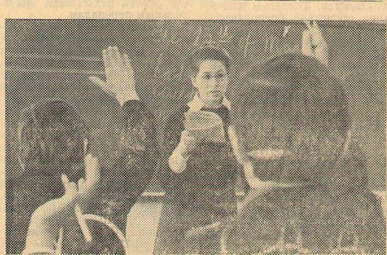
Легко на практике, если сумеешь увлечь ребят, активизировать, заставить думать.

В. БОГДАНОВ, член комитета ВЛКСМ института.