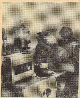
Учатся будущие учителя физики.

В течение 3 лет в Мосаленском районе работает матема-