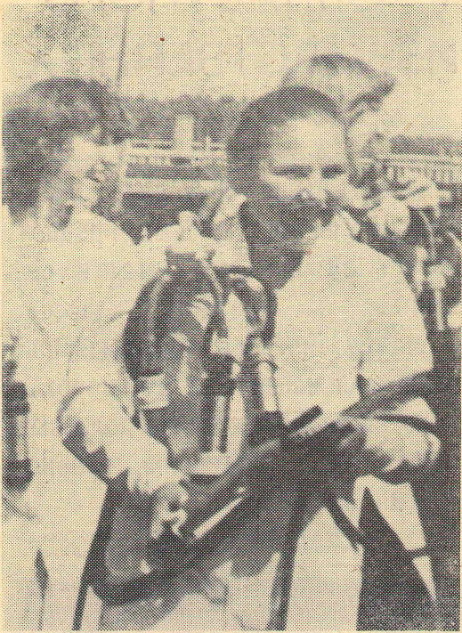
Хорошо поработали и настроение хорошее (УПБ Конезаводской средней школы Марьяновского района).