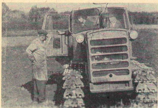
Члены УПБ Мысовской средней школы Муромцевского района осваивают технику.