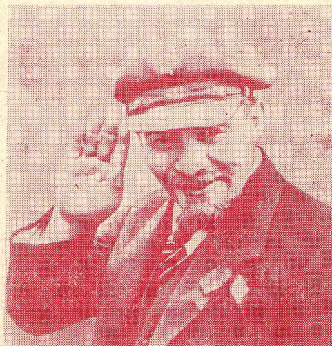
В. И. ЛЕНИН. 1 мая 1920 года.

ВЕЛИКИЙ Октябрь — первая в истории человечества победоносная социалистическая революция, совершенная рабочим классом России в союзе с беднейшим крестьянством во главе с В. И. Лениным. В итоге свержения власти буржуазии и помещиков было создано Советское социалистическое государство. После штурма Зимнего и ареста Временного правительства II Всероссийский съезд Советов по докладу В. И. Ленина принял Декрет о мире и Декрет о земле. Съезд изб-